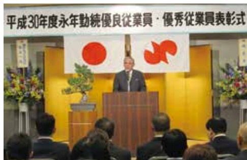
永年勤続表彰式の様子（昨年度）

同表彰式は、当所の継続事業として昭和27年から現在までの66年間、毎年この時期に開催しているもので、本年は、11月19日（火）網走セントラルホテルにおいて開催します。