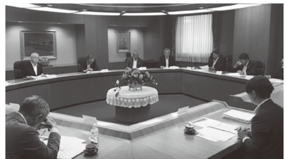
情報交換会の様子

講演終了後、当所と網走信用金庫の情報交換会が開催され、網走信用金庫が実施している「企業・地域支援の取組み」、当所が実施している「中小・小規模企業支援の取組み」について説明。中小・小規模事業者にかかわる大きな課題について更なる連携強化を進めていくための情報交換を行いました。