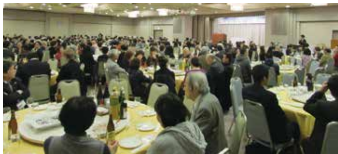
本年（2019）ワインの夕べのチラシおよび、昨年開催時の会場の様子

当所では、年に一度、会員事業所の元気づくりを目的に「会員の集い」を開催しています。