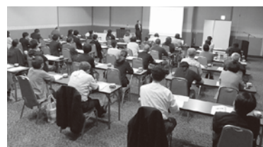
7/9(火) キャッシュレス対応セミナーの様子