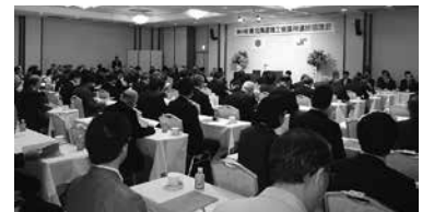
第99回東北海道の様子