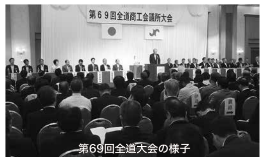
第69回全道大会の様子