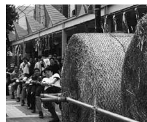
麦稈ロール引き大会の様子

夏まつり実行委員会では、今後も多くの皆様に喜んでいただけるよう協議を重ねて参りますので、引き続きご支援ご協力お願い申し上げます。