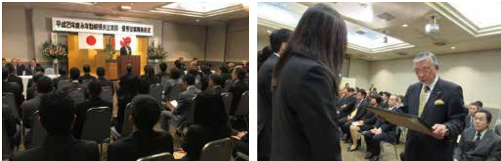
表彰式と祝賀会（昨年度）の様子

同事業は、会員事業所の従業員の労働意欲の向上と定着を図り、企業の発展に繋げることを目的に例年、当所設立月に開催している事業で、本年は11月20日（火）網走セントラルホテルにおいて開催いたします。