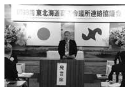
第98回東北北海道の様子