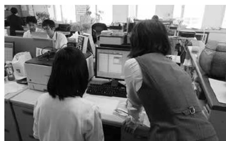
パソコンを使った入力作業を体験

当所では、9月12日(水)・13日(木)の2日間、網走桂陽高校の2年生の女子生徒1名をインターンシップ(就業体験事業)を受け入れました。 初日は、商工会議所の事業や仕組み・社会に出た時に必要なマナー・接客方法のほか、実際にパソコンを使った入力作業・担当者と一緒に金融機関を回るなど、日常業務を体験してもらいました。 2日目には、初日より複雑な事務処理に挑戦してもらいました。