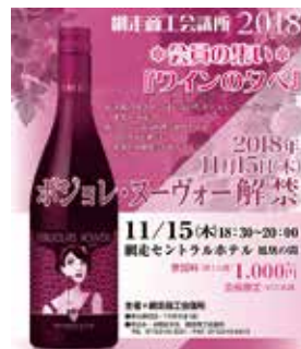
本年（2018）ワインの夕べのチラシおよび、昨年開催した時の会場の様子