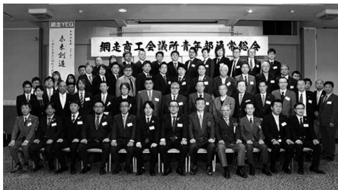
青年部定期総会集合写真

網走商工会議所青年部（YEG）は、当地域の振興発展や会員相互の親睦、企業経営者としての研鑽を積むことを目的に毎月1回の例会を基本として活動しております。現在、64名の会員が所属。目的実現のためにメンバーが一丸となって各種事業を実施しており、今年で創立25周年を迎えました。 今年度は、地元商工業の発展のため、網走の魅力と可能性を探るための研鑽を研鑽活動として実施したほか、人口減少社会