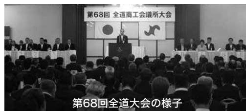
第68回全道大会の様子