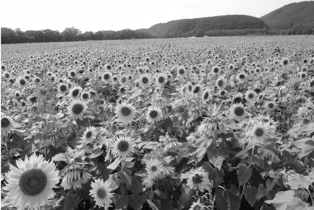
拓かれた商工会議所を目指し（イメージ網走大曲湖畔公園）