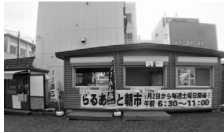
ラルズ跡地の「らるあーと朝市」