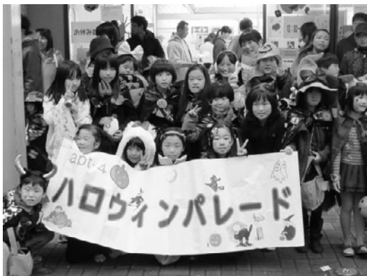
ハロウィンの仮装をする子供達

網走TMO事業委員会（委員長 高田 巧氏）では、中心商店街への誘客を促すこと等を目的に様々な催しを開催しております。 本年も街中のにぎわいを呼び起こす「まちなかマルシェ」を開催。網走桂陽高校商業科の生徒が企画開発した“桂陽スイーツ”の販売就業体験や、まちプラのイベントとして恒例となった、ふるさと駅弁かじめし（モリヤ商店）、網走の特産品の揚げたて蒲鉾（大谷蒲鉾店）、地元学校給食としても使用されているオピスのパンなどの他、ご当地