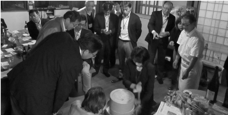
蕎麦の実を石臼で挽く参加者の様子

あばしりファン倶楽部は、仕事の都合などで網走に住むこととなった企業や官公庁などの転勤者（風の人）に、網走の魅力に触れてもらい網走のファンになってもらうことを目的に開催しております。