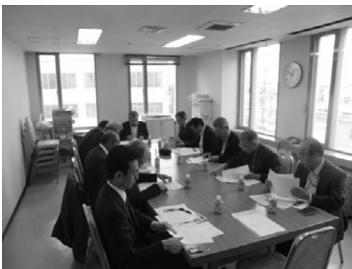
総務財政委員会の様子

また、当所の下半期事業として、11月に開催する「永年勤続優良従業員・優秀従業員表彰式」や「会員の集い」の実施内容について協議し、より多くの会員さんに参加してもらえるよう意見交換を行いました。