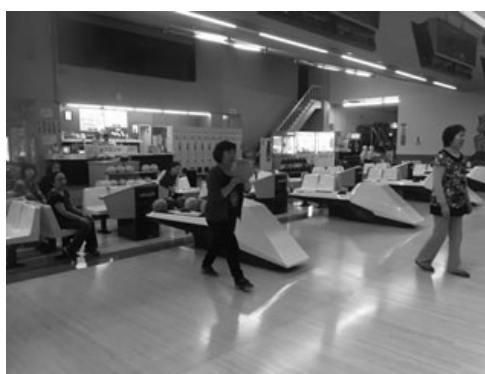
親睦を図るメンバーの様子