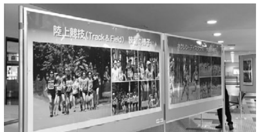
ユニフォームとパネルを展示