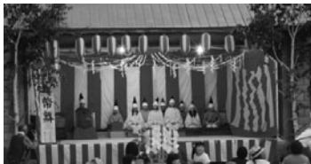
上(花火大会) 下(豊郷神楽)