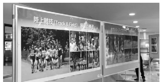
ユニフォームとパネルを展示