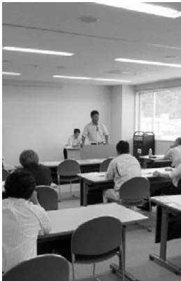
講演を受ける受講生

当日は15名が受講し、組織改善を行ない経営改善を志す方々が真剣に耳を傾けていました。