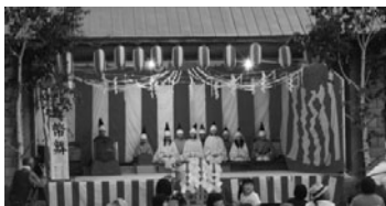
上(花火大会) 下(豊郷神楽)