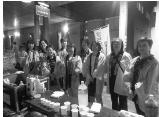
流氷おどりをサポートするメンバー

女性会では、7月26日(金)、7月例会として「あばしりオホーツク夏まつり流氷おどりのお手伝い等を行いました。 女性会曰く「昨年より流氷おどりの曲「流氷音頭」がリニョアルされ、参加者や団体が年々増加し、地域のお祭りが盛り上がることは大変うれしい。 私たちもこの祭りに参画することで地域活性化の一助となるよう継続してお手伝いしていきたい」と話されました。