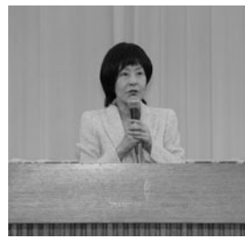
高橋はるみ知事より挨拶