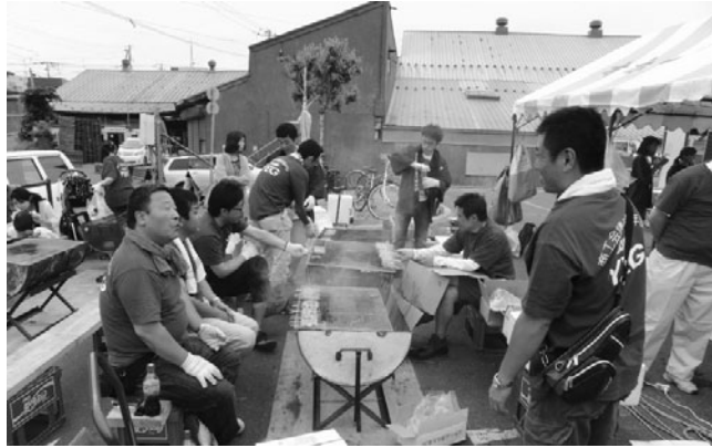
YEG屋の準備をするメンバー

青年部(YEG)は、7月20日(土)、オホーツク文化・交流センター特設会場において7月例会を開催しました。 本例会では、網走の地域経済発展を志す団体として、網走青年団体連合会が主催する「網走一番！夏祭り」に参画し、魅力あふれる網走の夏を市民や観光客に堪能していただき当地活性化に繋げていくことを目的に実施しました。