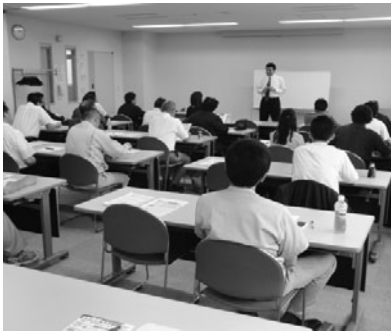
真剣に耳を傾ける受講者の様子

7月10日(水) エコーセンターにおいて、当所と斜網地域通年雇用促進協議会の共催による、標記セミナーを開催。会員事業所および関係機関等より29名が参加しました。