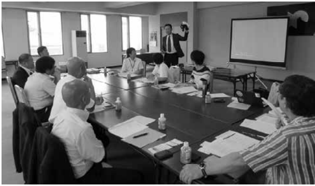
調査研究委員会の様子