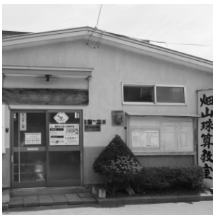
現在も多くの生徒が通う 台町の教室

「今後は、少子高齢化により、生徒数が減少してきているが、パソコンでは得る事のできない考える力、忍耐力、継続力などを鍛える事ができる珠算を広めていくことが自分の使命である」と語ってくれました。