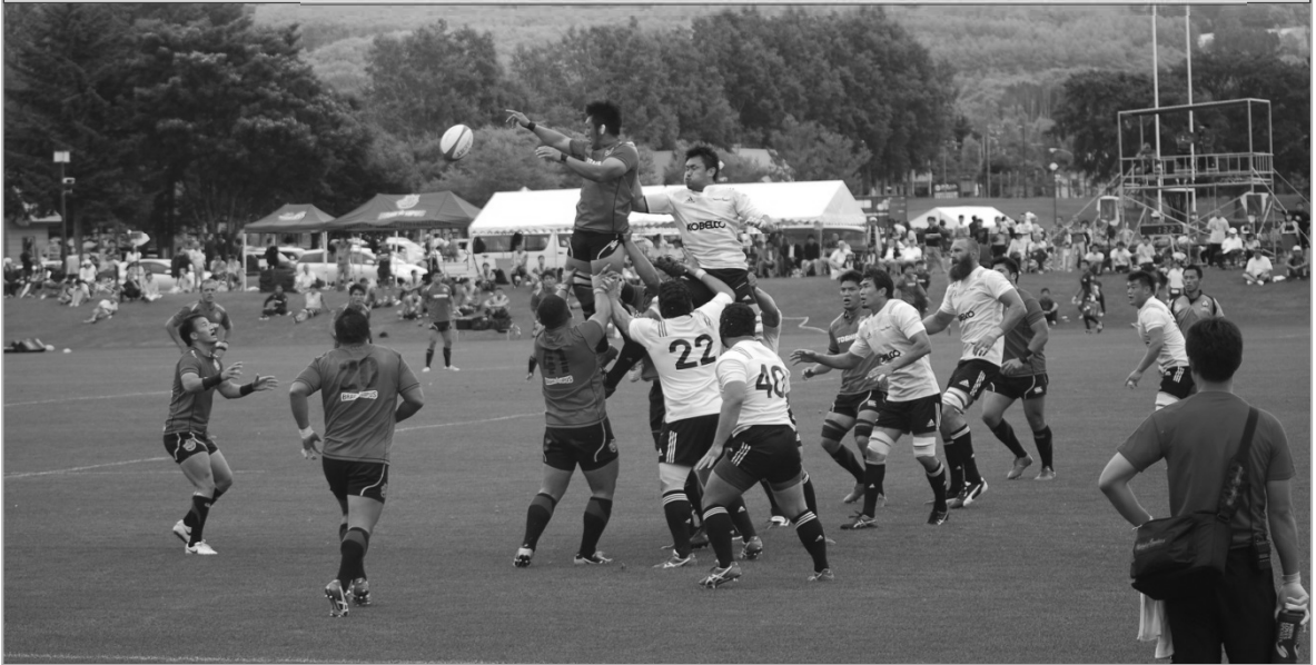
網走スポーツ・トレーニングフィールドでのラグビー練習試合の様子

公益財団法人日本ラグビーフットボール協会は、来年2019年9月20日（金）から11月2日（土）まで開催されるラグビーワールドカップ2019に出場する日本代表の事前チームキャンプ地を網走市と宮崎県宮崎市の2カ所に決定しました。