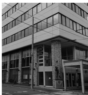
信組跡地にオープン