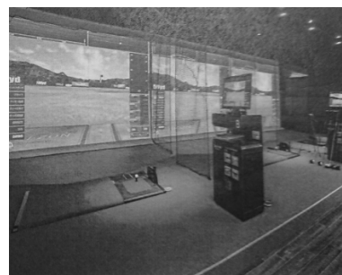
シュミレーションゴルフ練習場イメージ図