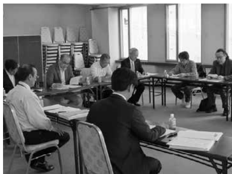
地域振興委員会の様子