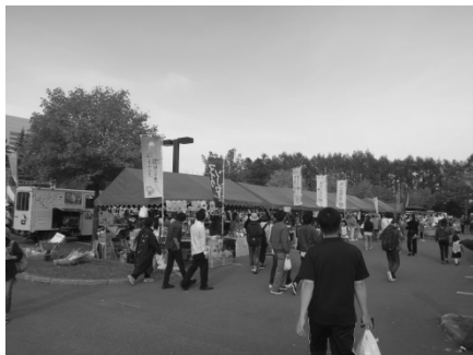
昨年の農大収穫祭の様子

海外の研究機関や自治体との連携業務、留学生の対応を行っています。網走市のさらなる国際化に貢献できればと思いますので、よろしく願います。