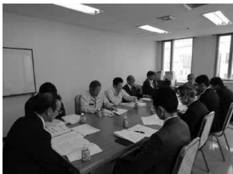
経営委員会の様子