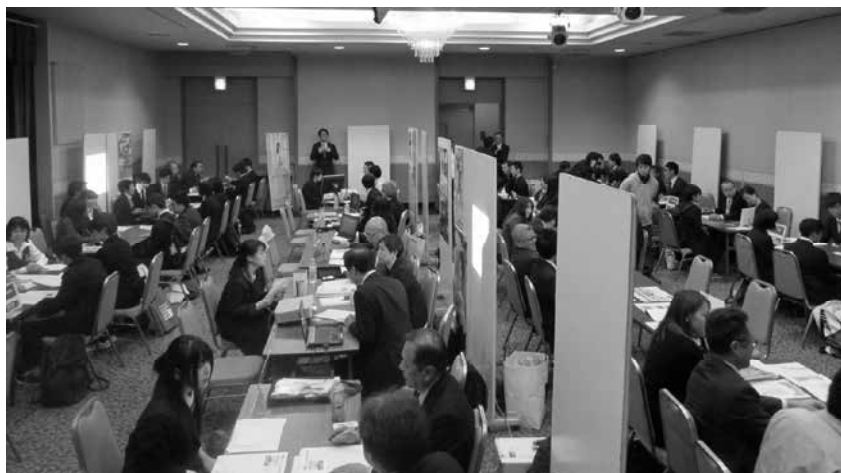
各企業の担当者の話を真剣な表情で聞く高校生の様子