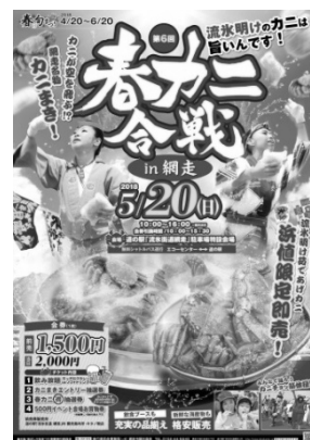
春カニ合戦ポスター