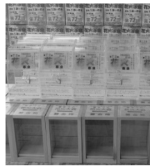
3種類の募金箱を用意

本年も募金箱の設置について、ご協力いただける事業所を募集しておりますので、ご支援ご協力の程、よろしくお願い申し上げます。